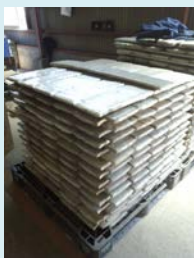
発泡スチロールのインゴット

発泡スチロール溶融機の老朽化に伴い昨年12月に溶融機を更新しました。今回更新した溶融機は火を使わずに電気熱により溶融する為、溶融に伴うCO 2 の発生を抑え、効率よく1日に480kg処理する事が出来ます。