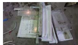
アスベスト含有 アスベスト無し