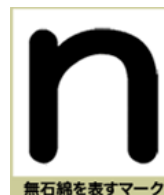
無石綿を表すマーク