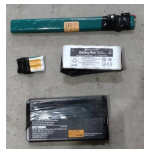
リサイクル電池 (絶縁済み)