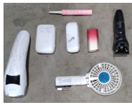
充電電池内蔵 小型家電