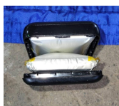
肥大した充電電池